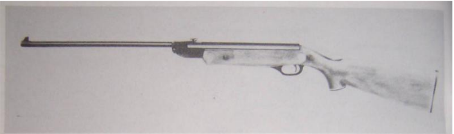
The Baikal Air Rifle

MODEL IJ-22, alias Model 2-55, alias "The Cossack", alias "Baikal", alias G530.